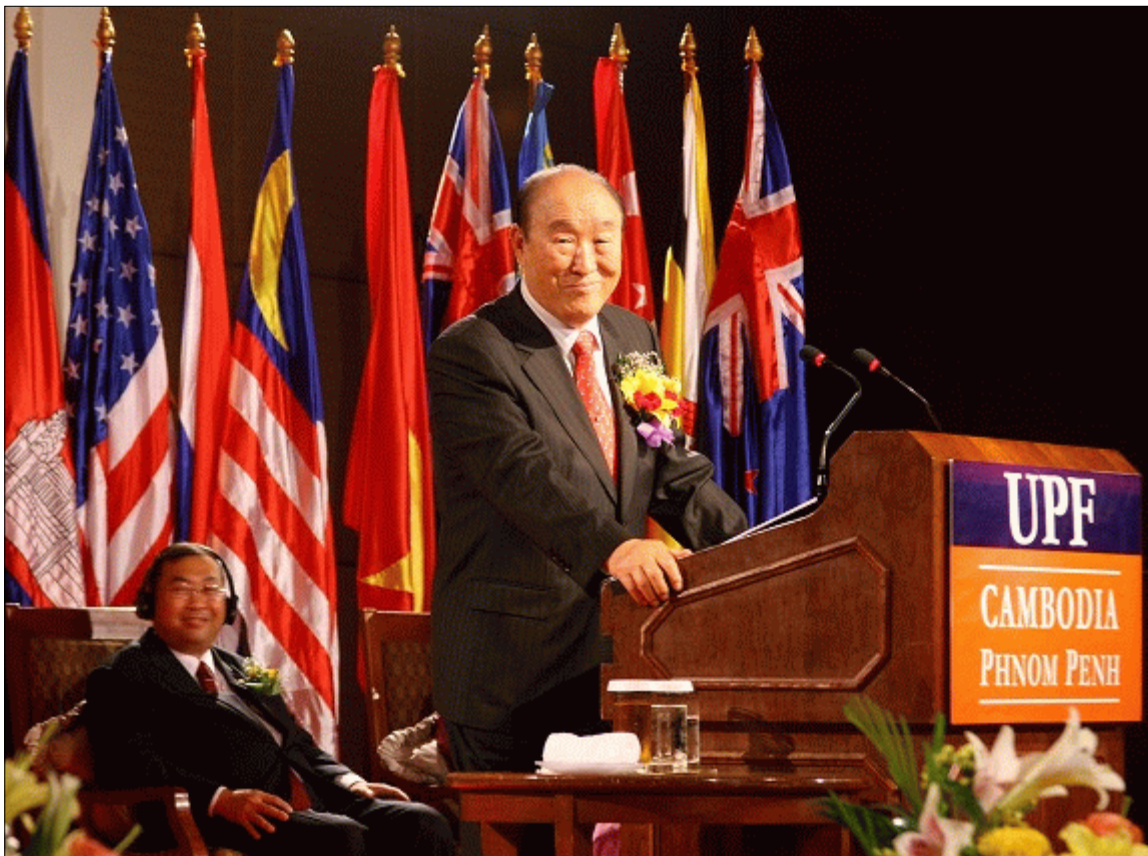
Инаугурация Федерации за всеобщий мир в ходе турне по 120 странам мира, 2005 г.

Опыт человека, который, поверив в светлое будущее, сумел раздвинуть горы ненависти и непонимания