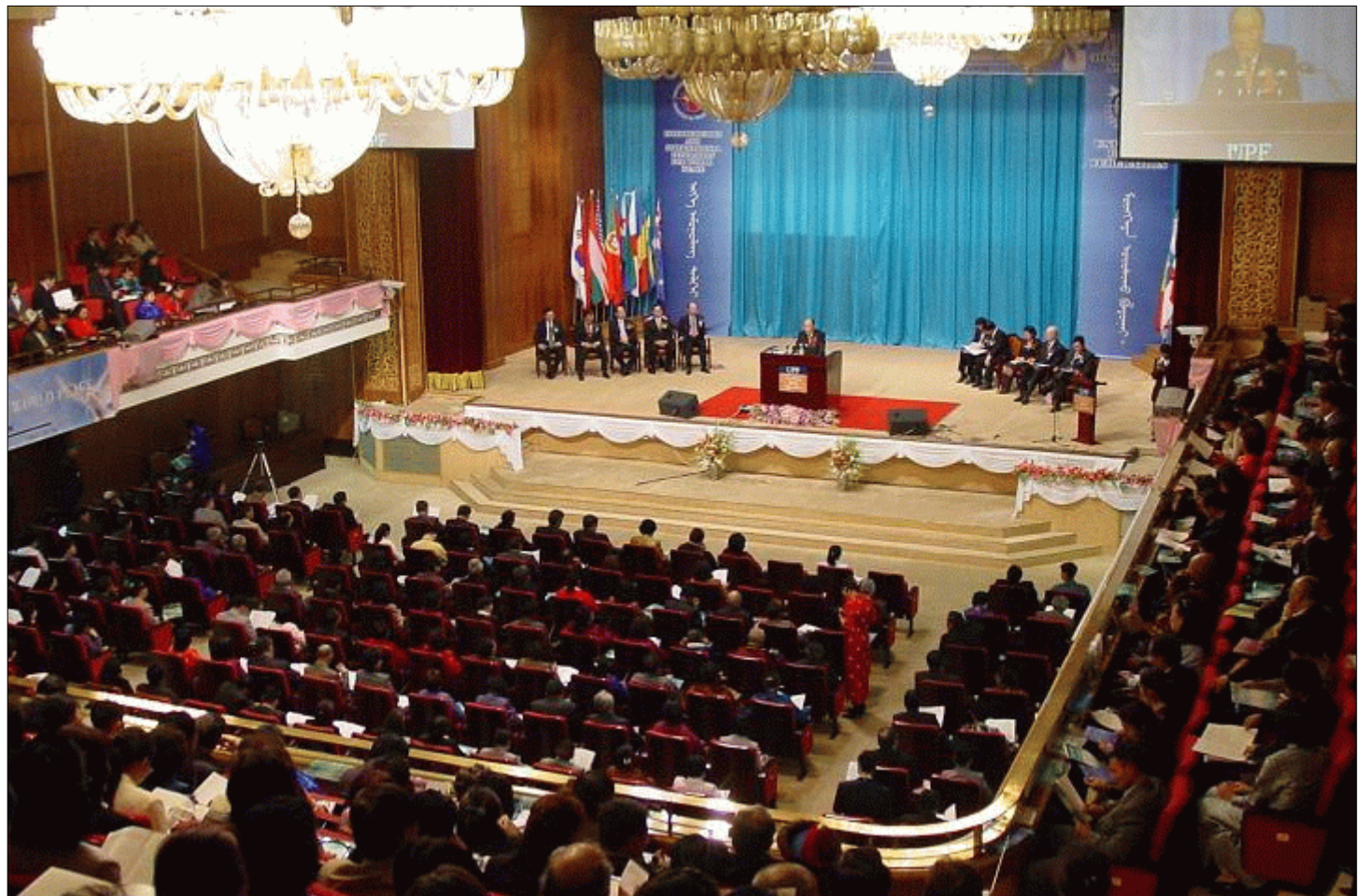
Выступление д-ра Муна на инаугурации Федерации за всеобщий мир в Монголии, Улан-Батор, 16 октября 2005 г.

начавшиеся в Монголии в 1990 году, послужили причиной возникновения философского вакуума, а вторжение западных влияний привело к падению нравов в среде молодежи. В этом контексте восстановление нравственных ценностей в школьном образовании представлялось задачей чрезвычайной важности.