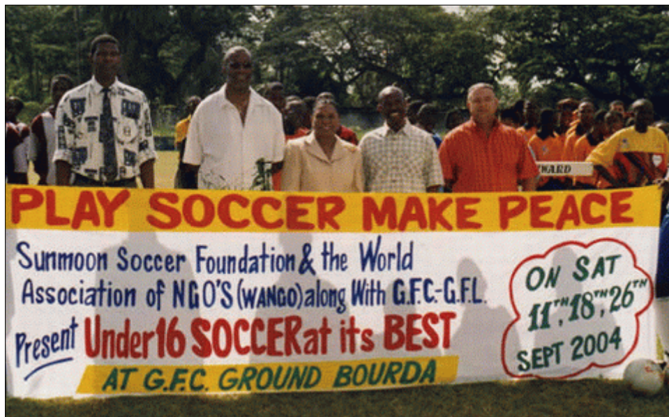
Турнир в Гайане, Южная Америка

Проект "Играйте в футбол, боритесь за мир!" возник благодаря базирующемуся в Южной Корее футбольному Фонду Сон Мун Соккер Фаундейшн, который выделил миллионы долларов под конкретные проекты развития футбола и миротворче-