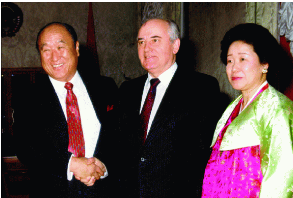
Встреча с Президентом СССР Михаилом Горбачевым в Кремле, 11 апреля 1990 г.

к "жгучим проблемам современности", включая проблему мира во всем мире.