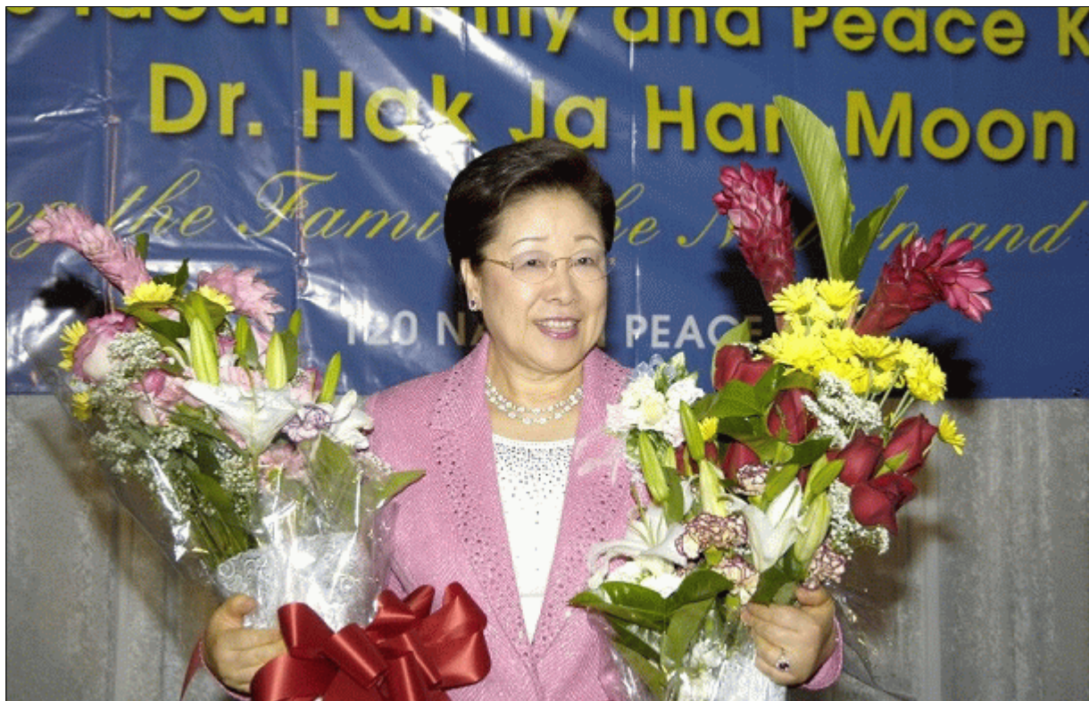
Выступление г-жи Хак Джа Хан Мун в Нассау, Багамские острова, 4 августа 2006 г.

Преподобный Мун, имеющий полномочия Небес, явился как Истинный Родитель человечества и Царь мира. Он исполнит свое обещание Небесам. Он обязательно сделает процветающую эпоху глобального идеального Царства мира на земле. Итак, помните, что все собравшиеся здесь сегодня являются центральными личностями, ответственными за становление глобального идеального Царства мира на земле, служа Царю и Царице мира - Истинным Родителям.