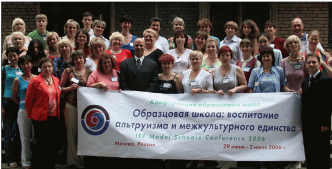
Общая фотография участников конференции образцовых школ

Сайт МАОО «МФО»: www.mfo-rus.org , эл.почта: mfo@mfo-rus.org Адрес для писем: 109387, Москва, ул. Кубанская, д.29, стр.1