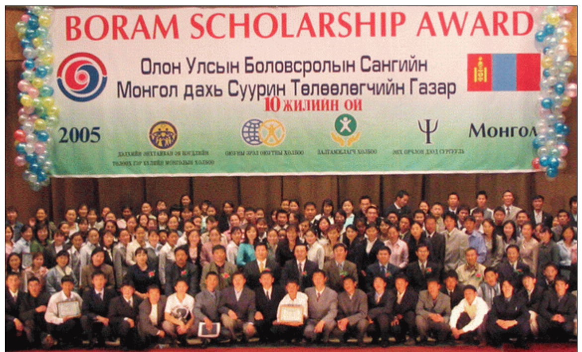
Один из проектов Движения Объединения в Монголии, 2005 г.

Все началось с возрождения нравственных принципов в среде молодежи. Теперь мы исполнены надежды на будущее, и это позволяет нам вносить вклад в дело мира, используя наше культурное наследие. Надеюсь, что исторический путь монголов послужит примером того, как можно воплотить всеобщий мир на земле.