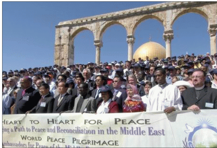
Акция за мир на Ближнем Востоке, 2004 г.

Под эгидой миротворческих инициатив д-ра Муна было создано множество международных организаций, работающих в самых разных сферах: семья, образование, культура, СМИ, политика, религия, спорт и т.д. Цель у всех одна - помогать делу мира. Способы этой помощи разные, но принцип одинаков для всех. Он заключается в подходе, в отношении к любой работе или деятельности - не замыкаться на своих личных интересах, а думать об общем благе.