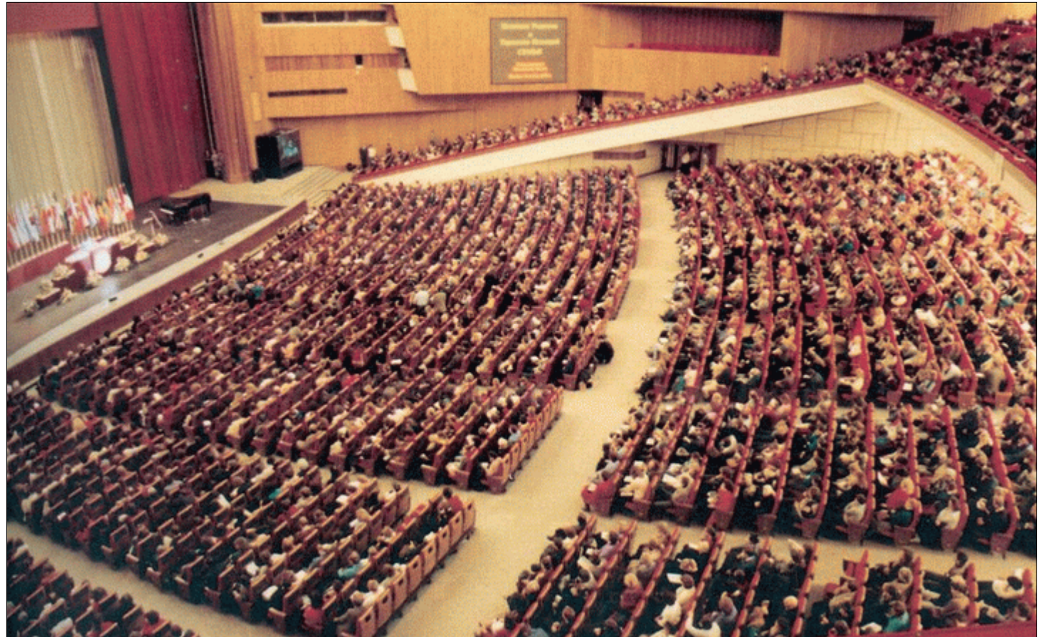
Выступление г-жи Хак Джа Хан Мун в Кремлевском Дворце Съездов, 21 ноября 1993 г.

Бог сотворил Адама и Еву как будущих прародителей человечества. Он вложил всего Себя до конца, чтобы воспитать их как собственных сына и дочь, связанных с Ним узами любви, жизни и рода, ибо отношения родителей и детей являются высочайшими и важнейшими отношения-